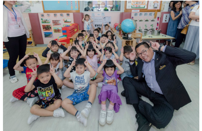
李博士（右一）上任後與董事局成員四出巡視東華三院的服務單位，了解單位運作外，亦與服務使用者多溝通，以提供適切的服務。

除東華外，李博士現時亦出任其他機構的管治層，他說：「我事前已考慮這些崗位與我作為東華主席並無利益衝突，亦希望能以我在東華的經驗與其他社福機構分享，為社會多出分力。」