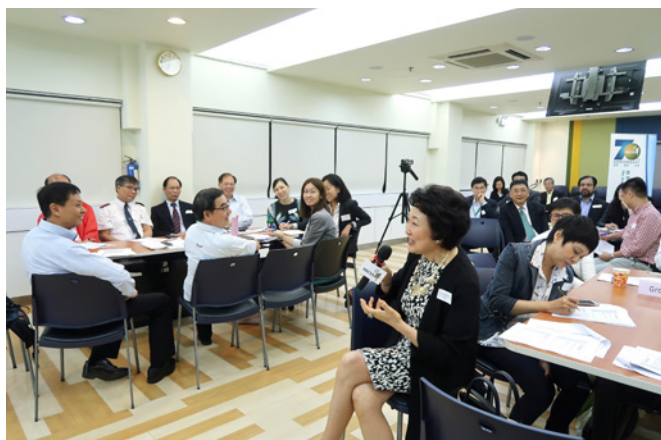
參加者分享機構處理風險管理的經驗。

盧博士明確地指出：「最大的風險就是忽略風險管理。」他重申因風險本身存在於所有活動，所以提高風險意識十分重要，機構更應小心墜入因畏懼風險而變得過分保守的陷阱。他建議機構管治層把風險管理納入董事會的定期會議議程中，並刻意在機構建立風險管理文化。畢竟，有效的風險管理有賴更多相關政策互相配合：利益衝突、舉報、處理投訴、員工薪酬、儲備、私穩、資訊科技保安、平等機會等等，都是有效風險管理制度必要的範疇。