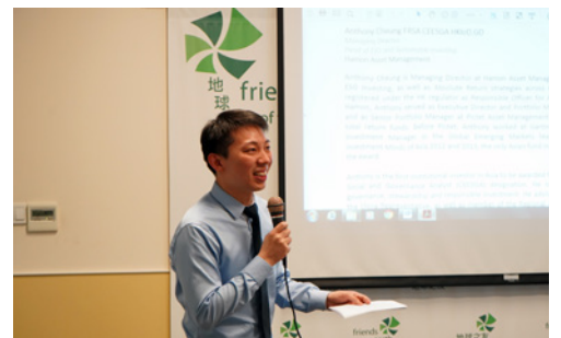
張先生在「商界領袖分享」講座中，談及他對社會責任投資的見解。